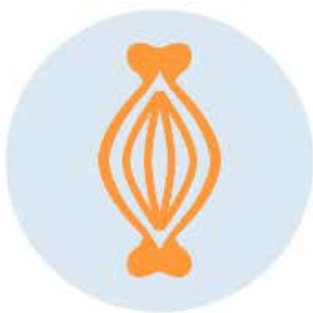
"Ломота" в теле