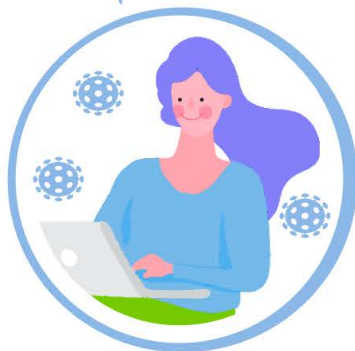
ЛЕГКОЕ ТЕЧЕНИЕ COVID-19 В СЛУЧАЕ ЗАРАЖЕНИЯ