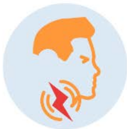
Боль в горле