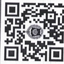
КРАСНОДАРСКОЕ ВЫСШЕЕ ВОЕННОЕ УЧИЛИЩЕ ИМЕНИ ГЕНЕРАЛА АРМИИ С.М.ШТЕМЕНКО